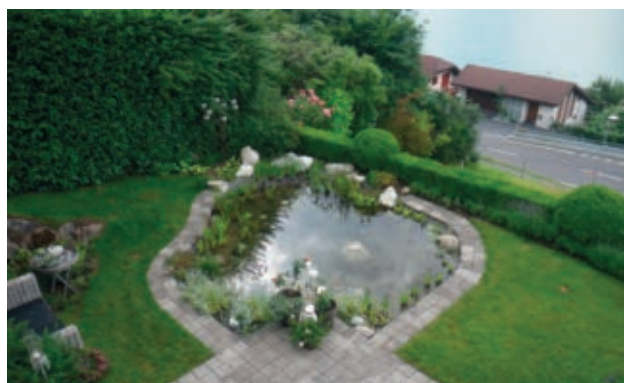
Beispiel einer gelungenen Gartengestaltung