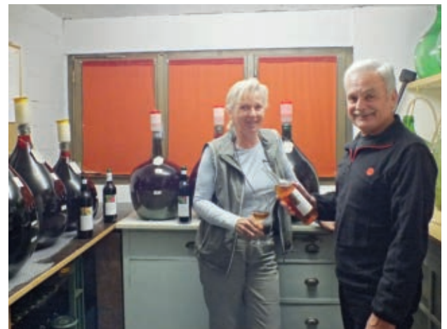
Zuhause im Weinkeller

In Scorrone werden die Trauben gepresst und danach wird der Saft nach Oberdorf gebracht, wo die Weinproduktion erfolgt. Erwartet werden rund 100 Flaschen «Huebbödeler» und 300 Flaschen von Italien. Nach der Gärung in Fässern wird der Wein in grosse Flaschen umgezogen. Etwa im April wird der feine Saft in Flaschen abgefüllt und mit Etiketten geschmückt. Diese sind das Werk von Elsbeth. Passend zum Inhalt und der Herkunft hat sie diese liebevoll gestaltet und farbenfroh umgesetzt.