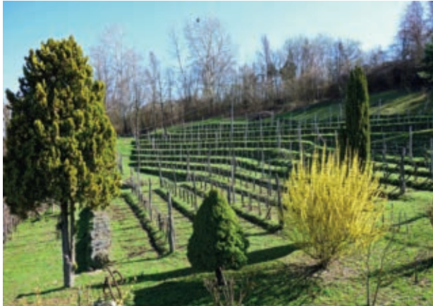
Rebberg in Scorrone

um schliesslich einen terrassierten Rebberg mit 350 Stöcken zu bepflanzen. Nebst ein paar einzelnen lokalen Sorten sind es heute hauptsächlich die roten Merlot-, Barbera-, Dolcetto-, Nebbiolo- und die weissen Chardonnay-Trauben.